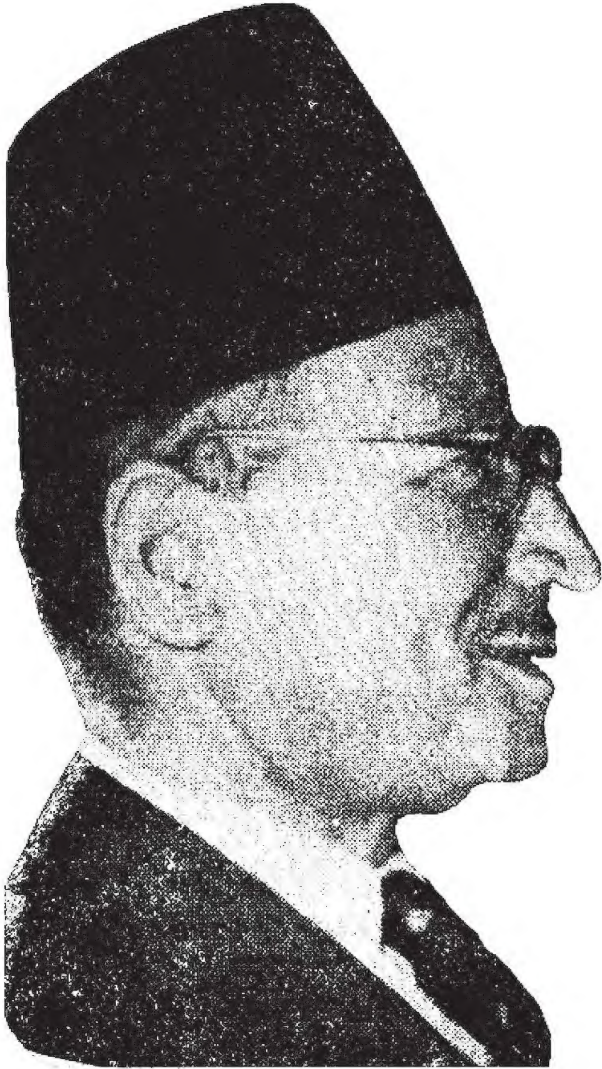
• المستشار حسن الهضيبي المرشد العام للإخوان المسلمين